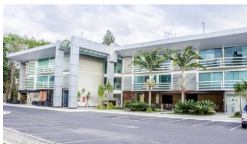
Vista da fachada do comércio local da QI 17.