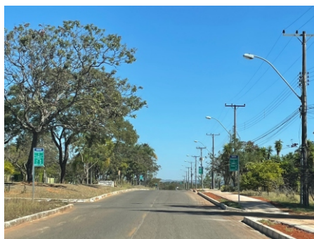
Acima e ao lado as novas calçadas do SMDB 2 e 3. Tão aguardadas pelos moradores. Foram executados 2.836 metros de calçada.

Ao lado, as novas calçadas do SMDB 2 e 3. E, abaixo, as do SMDB 1. Foi realizada ainda a ligação entre a QI 17 e o SMDB.